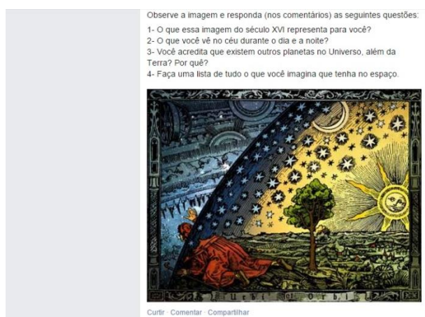
Figura 01 – Atividades: problematização inicial

No primeiro momento pedagógico, os alunos analisaram uma imagem representativa do Universo do século XVI (figura 01) e registraram nos comentários do grupo, logo abaixo da imagem, suas opiniões sobre a gravura.